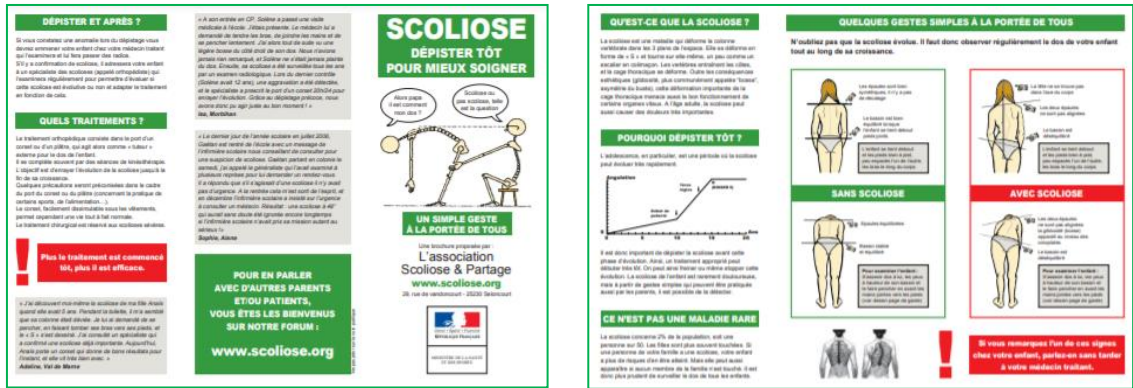
Brochure de dépistage de l'Association

Informez et sensibilisez sur l'importance du dépistage de la scoliose. L'efficacité du traitement dépend de la précocité de sa mise en place. L'association a à cet effet créé une brochure (qui a été validée par le ministère de la santé) pour montrer aux parents comment regarder eux-mêmes le dos de leurs enfants et ainsi envisager une consultation médicale pour vérification.