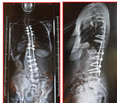
après opération de face et de profil